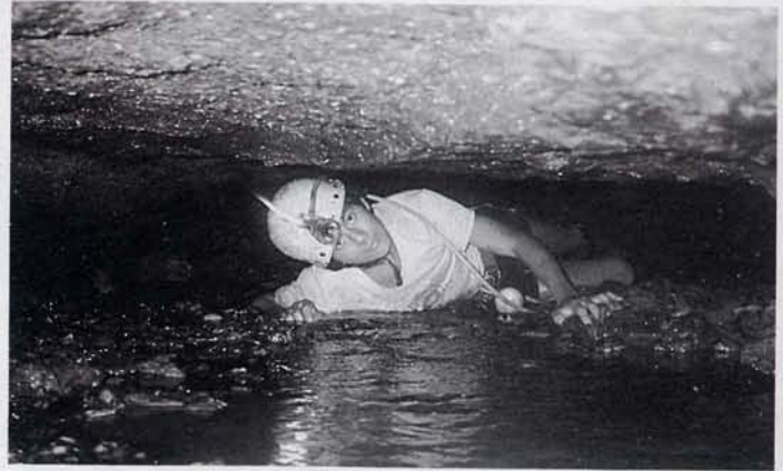
(3) Voir légende dans articles Bolivie-Equateur

Ces listes tiennent compte des résultats de toutes les expéditions qui se sont succédées au Pérou de 1969 à 1987 à l'exception de la dernière expédition anglaise (mai à juillet 1987). Alain GILBERT et Yves SAM-MARTINO