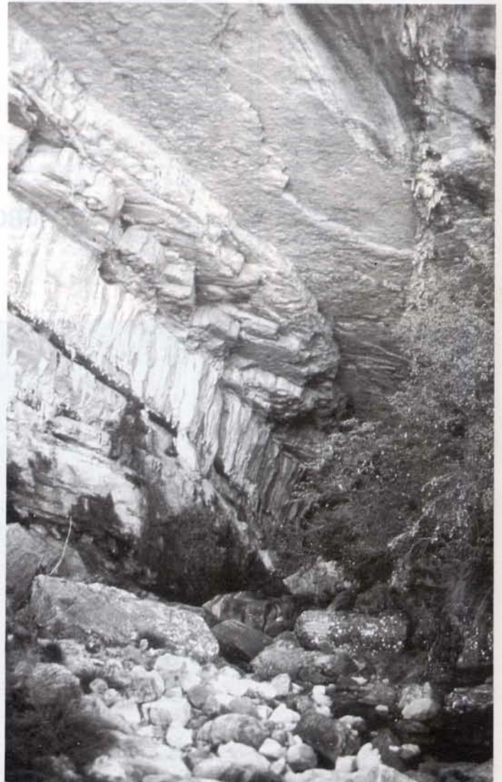
(6) Voir légende dans articles Bolivie-Equateur

Lors de notre séjour C. Morales Bermudez et moi-même avons reporté nos recherches sur la vallée d'Irma Grande et exploré une cavité située au fond d'une grande doline. Gompina est une cavité qui se développe dans une faille orientée à 340°, alternant zones de puits ou ressauts et méandres étroits, nos recherches se sont achevées à la cote - 116 m en profondeur pour un développement de 376 m. L'ouverture principale est à 3 625 m d'altitude. Près du fond nous avons descendu un très joli P29, le plus important de la cavité. En bordure des falaises surplombant le rio Marañón nous avons pu explorer Ashuac, un gouffre d'effondrement de 53 m de profondeur dans lequel nous avons eu la surprise de découvrir un cadavre à moitié momifié (Altitude 3 800 m). Alain GILBERT