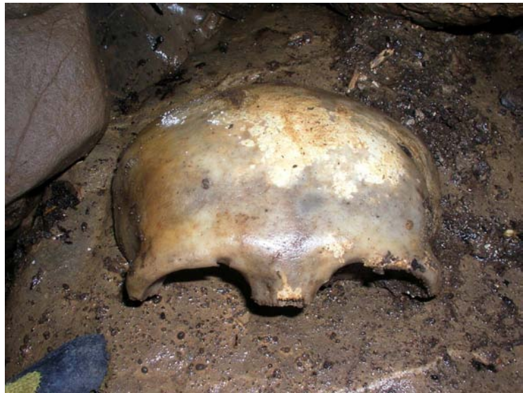
Fig. 4 : Calotte crânienne du Tragadero del Craneo.