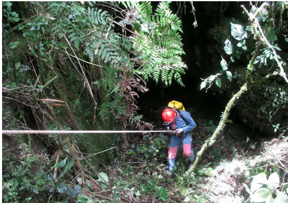
Fig. 2 : Ressaut d'entrée du tragadero del Craneo.