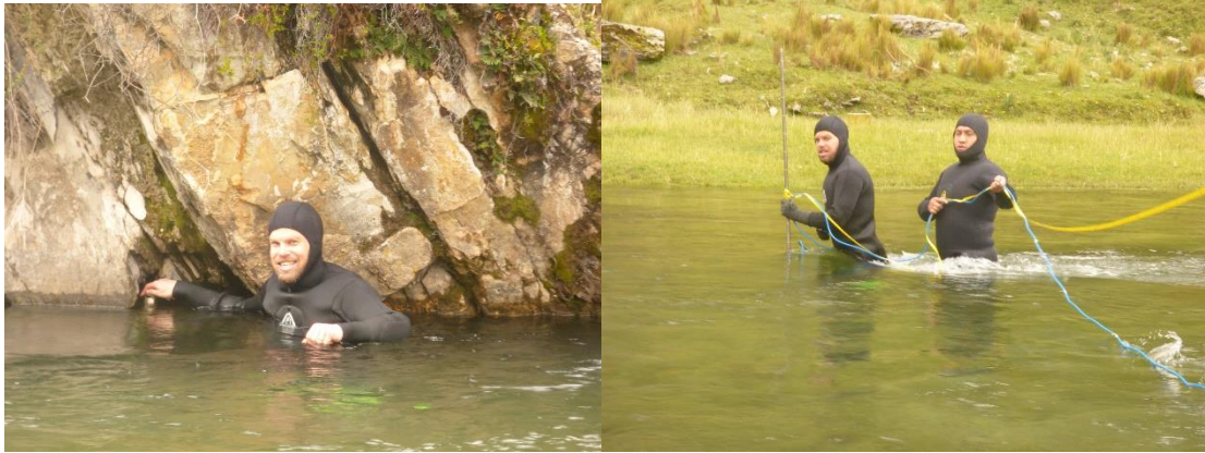
Photos 2 et 3: g. La CTD quasiment sous l'eau ; d. Jaugeage de la resurgence Ucrumachay