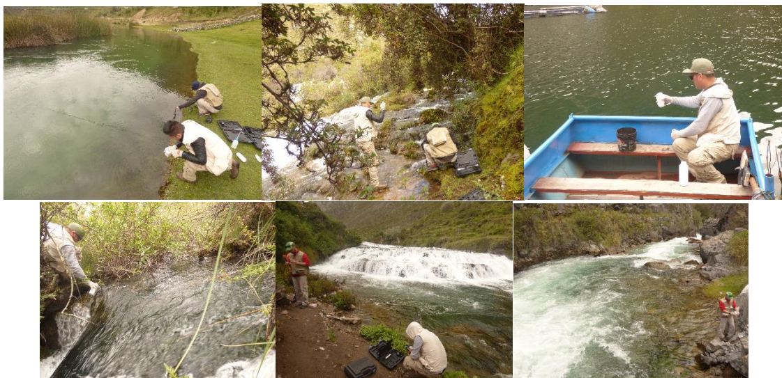
Photos 5 à 11 (de g. à d. et de h. en b.) : échantillonnage du fleuve Cañete aux points Vilca, Laguna 2, Huallhua, Sirena, Huancaya et Piquecocha

La route qui unit Tanta à Vilca est enfin ouverte et nous permet de rejoindre Vilca en un peu moins de 40 min. Durant la matinée nous échantillons le fleuve Cañete entre les stations Vilca et Piquecocha (Photos 5 à 11)