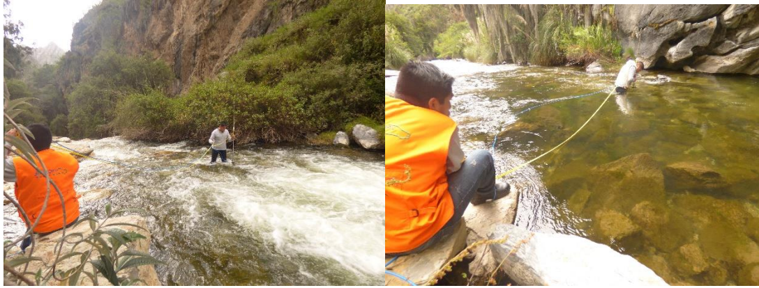
Photos 12 et 13 : jaugeage du Tragadero Uncha et de la Résurgence Miraflores