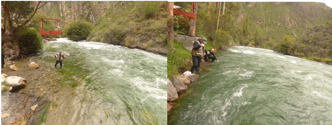
Photos 18 et 19: échantillonnage du fleuve Cañete aux points Tinco Alis (g.) et Azucha (d.)

Nous concluons la mission de terrain avec l'échantillonnage du fleuve Cañete aux points Tinco Alis et Azucha (Photos 18 et 19)