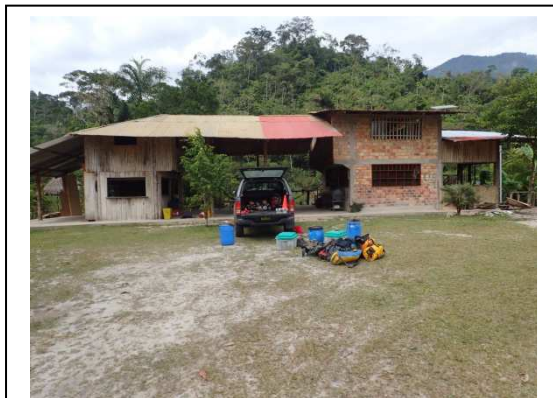
Le camp de base à Palestina (BL, 15/08/2017)

Lever à 6 h 30 au lever du jour. La préparation du petit-déjeuner (riz, pommes de terre, café) est longue. Nous partons finalement vers 9 h 30. La marche d'approche vers la cavité est raide tout du long. Il faut tailler certains passages à la machette. Nous mettons finalement presque 1 h 30 pour monter (avec deux haltes de 10 min). Nous pénétrons sous terre vers 11 h 15. Josiane reste dans la zone d'entrée pour faire une riche récolte bio. Le