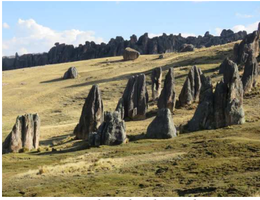
Bosque de Piedras de Huaylay