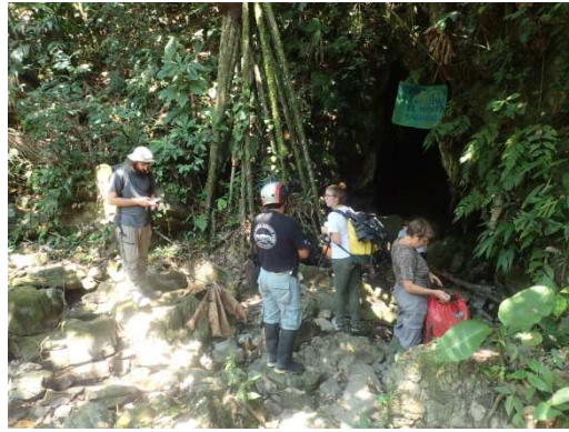
Tragadero de Huayna Capac

Nous nous octroyons une journée détente. Après le petit-déjeuner dans la même boulangerie que la veille, nous nous promenons à pied pour visiter le marché qui est très coloré : nombreuses photos. Puis nous partons vers 10 h pour aller dans le parc national de Tingo Maria et plus spécialement sur le