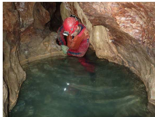
Cueva del Lobo Perdido (BL, 27/08/2017)