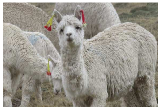
Alpaga (BL, 05/09/2017)

Lever vers 7 h 30. Petit-déjeuner tranquille puis matinée non moins tranquille à discuter, faire le point et refaire nos sacs. Nous déjeunons vers midi puis partons peu après 14 h en taxi pour rejoindre l'aéroport. Vers 16 h 30 nous sommes en salle d'embarquement pour un décollage prévu à 18 h 25. Nous arrivons chez nous, après un trajet Paris-Lyon en TGV, samedi vers 19 h 30.