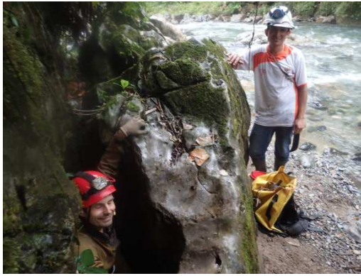
Puits à côté du rio Yurakyaku (BL, 29/08/2017)