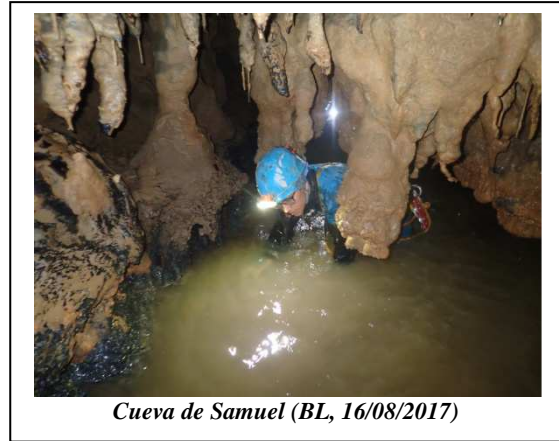
Cueva de Samuel (BL, 16/08/2017)