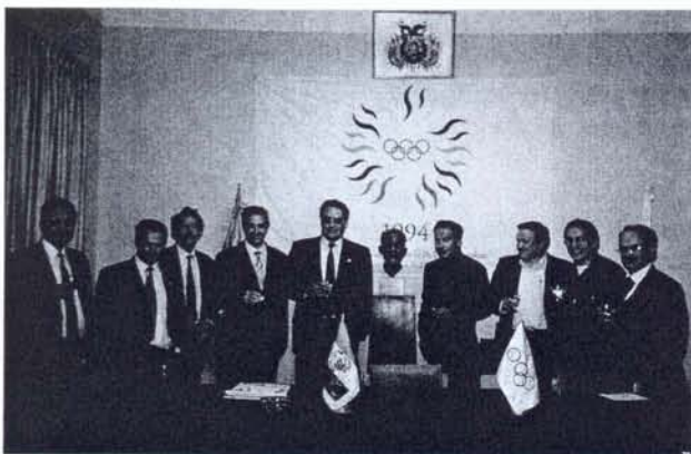
Recepción en el Comité Olímpico de Bolivia.

En la base de uno de los tres conductores de la cordillera oriental, al pie del Señor de la Luz "Illampu", en el valle del río San Cristóbal, a unos 150 m. sobre su cauce y a 2590 m. sobre el nivel del mar, se halla la Gruta de San Pedro en la que como dijimos se desarrolló la tercera parte de este Curso, en la que se realizaron diversas prácticas, tanto de instalación -se instaló con los alumnos más avanzados, un pasamano de aproximadamente 70 m. en el nivel superior- como de pro-