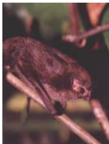
Fig. 1: Registros fotográficos de Diphylla ecaudata en (a) las Cavernas del Repechón, P. N. Carrasco, Cochabamba y (b) en Mataracu, P. N. Amoro, Santa Cruz.