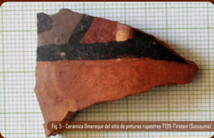
Fig. 5 - Cerámica Omereque del sitio de pinturas rupestres TT28-T'iratani (Sucusuma).

Tenemos también evidencia de interacción, desde el Horizonte Medio, con los valles cochabambinos donde se desarrollaron culturas locales en contacto con el centro nuclear de Tiwanaku. Lo atestigua la cerámica Omereque encontrada en T'iratani y Llamachaqui (Fig. 5). Algunos de los sitios de arte rupestre torotoreños pueden entonces remontarse a esta época, con el uso de múltiples colores en las pinturas.