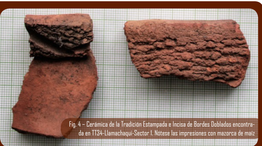
Fig. 4 - Cerámica de la Tradición Estampada e Incisa de Bordes Doblados encontrada en TT34-Llamachaqui-Sector I. Nótese las impresiones con mazorca de maíz