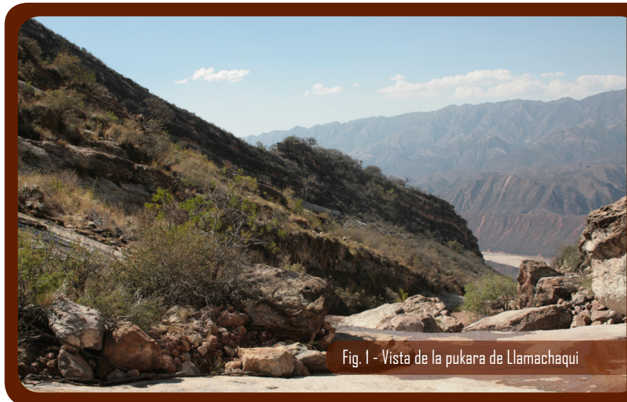
Fig. 1 - Vista de la pukara de Llamachaqui

El estilo cerámico Yampara encontrado, el Presto Puno, pertenece al Horizonte Tardío, cuando los caciques Yampara estrecharon alianzas con los Inkas, reforzando su poder y expandiendo el control sobre nuevos territorios, como el caso de Torotoro, con el propósito también de frenar militarmente la avanzada de los grupos Chiriguanos-Guaraní (Barragán 1994, Lima 2008).