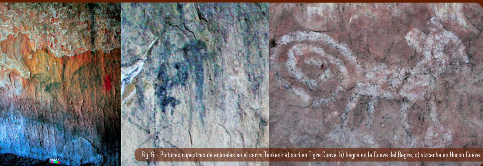
Fig. 6 - Pinturas rupestres de animales en el cerro Tankani: a) suri en Tigre Cueva, b) bagre en la Cueva del Bagre, c) vizcacha en Horno Cueva.

Las cuevas con arte rupestre del cerro Tankani expresan aspectos espirituales ligados a la actividad pastoril o de caza, que se conservan hasta nuestros días, ya que la mayor parte de las figuras representadas son de animales, sobre todo camélidos, pero también aves, tarukas (ciervo andino), vizcachas y quizás también un bagre (Fig. 6). Se pueden notar diferentes estilos pictóricos, y diferentes escenas de actividades: algunas representaciones son manadas de camélidos domesticados (que caminan en fila), mientras otras muestran escenas de cacería con hombres al lado de los animales llevando algún instrumento en las manos (Fig. 7). Estas últimas podrían datar de tiempos muy remotos, desde el Precerámico o Formativo antiguo, pero serán solamente las excavaciones arqueológicas las que podrán esclarecer este aspecto, así como muchos otros de la arqueología de Torotoro.