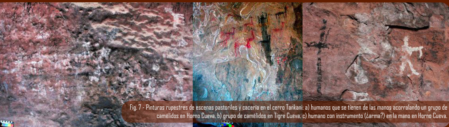
Fig. 7 - Pinturas rupestres de escenas pastoriles y cacería en el cerro Tankani: a) humanos que se tienen de las manos acorralando un grupo de camélidos en Horno Cueva, b) grupo de camélidos en Tigre Cueva, c) humano con instrumento (¿arma?) en la mano en Horno Cueva.